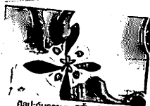
ศิลปะกับธรรมชาติฟื้นฟูใจเด็ก