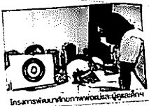
โครงการพัฒนาทักษะภาพยนตร์และยูทูบเด็กฯ