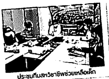
ประชุมกับสหวิชาชีพช่วยเหลือเด็ก