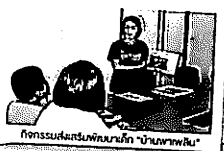
กิจกรรมส่งเสริมพัฒนาเด็ก "บ้านภาพฝัน"

ท่านสามารถร่วมทำบุญโดยโอนเงิน บัญชีออมทรัพย์ มูลนิธิศูนย์พิทักษ์สิทธิเด็ก