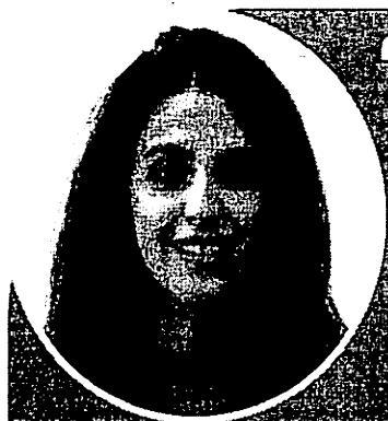
เจเลียมย์

“ฉันเป็นปีที่เพิ่งค้นคว้าทางจิต วิสัยทัศน์และเปิดมุมมองของฉัน ในทิวทัศน์จากกรุงลอนดอนกับคน ใหม่ ๆ และค้นพบความมหัศจรรย์ ของสหราชอาณาจักร ตอนนั้นฉัน กลัวว่าโลกกว้างขนาดไหน และ ไม่มีขอบเขตใด ๆ บ้างกว้างกัน ความมุ่งมั่นของเราได้เมื่อความ สำเร็จของเราจุดประกายขึ้น