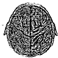
จินตปัญญาญาณ

จากผังการพัฒนาสมองด้านจินตนาการ การสอนศิลปะแบบ BBL จะช่วยพัฒนาสมองได้ทุก ระดับ