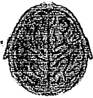
จินตลักษณ์