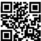
QR Code 1

ผู้อำนวยการสำนักงานเลขานุการ ปลัดกรุงเทพมหานคร สำนักปลัดกรุงเทพมหานคร